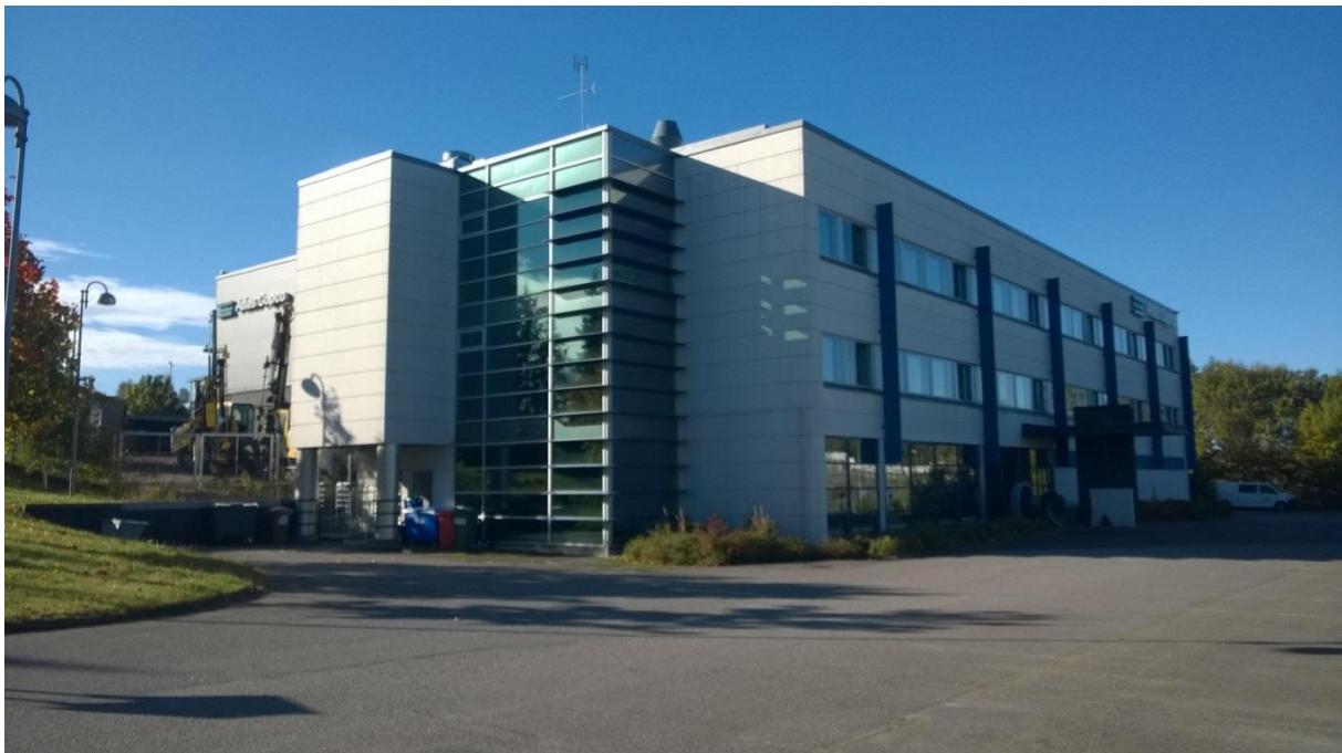
Tuupakankuja 1, Vantaa

Kaikkiin palveluihimme sisältyy sovituslainen raportointi sekä yhteydenpito eri osapuolten kanssa, kuten kiinteistön omistajat, käyttäjät, palveluntuottajat ja viranomaiset.